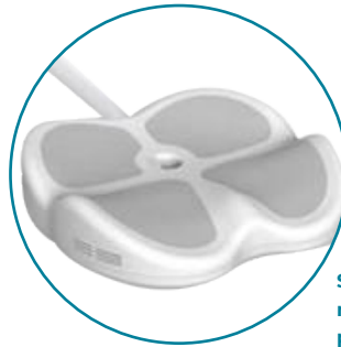
SCULPTCHAIR, mejora del suelo pélvico